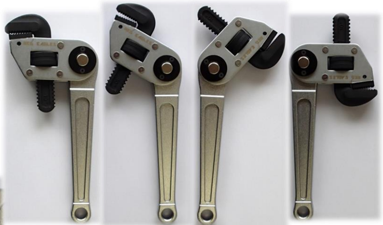
【左から0° 45° 135° 180°】

●品番 RTPW-250 ●品名 マルチアングル・パイプレンチ ●定価 オープン